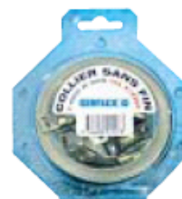
Coque de bande sans fin